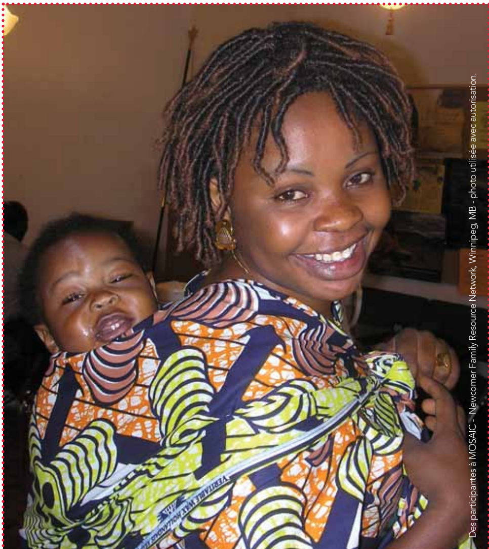
Des participantes à MOSAIC - Newcomer Family Resource Network, Winnipeg, MB - photo utilisée avec autorisation.